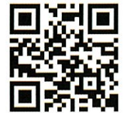
申込用二次元コード

二次元コードを読み取り、メール送信してください。 読み取れない場合は下記アドレスに 名前、フリガナ、医療機関 所属部署、職種、希望単位、希望会場、連絡先 を送信してください。 info_kangojissenryoku@skk-net.com